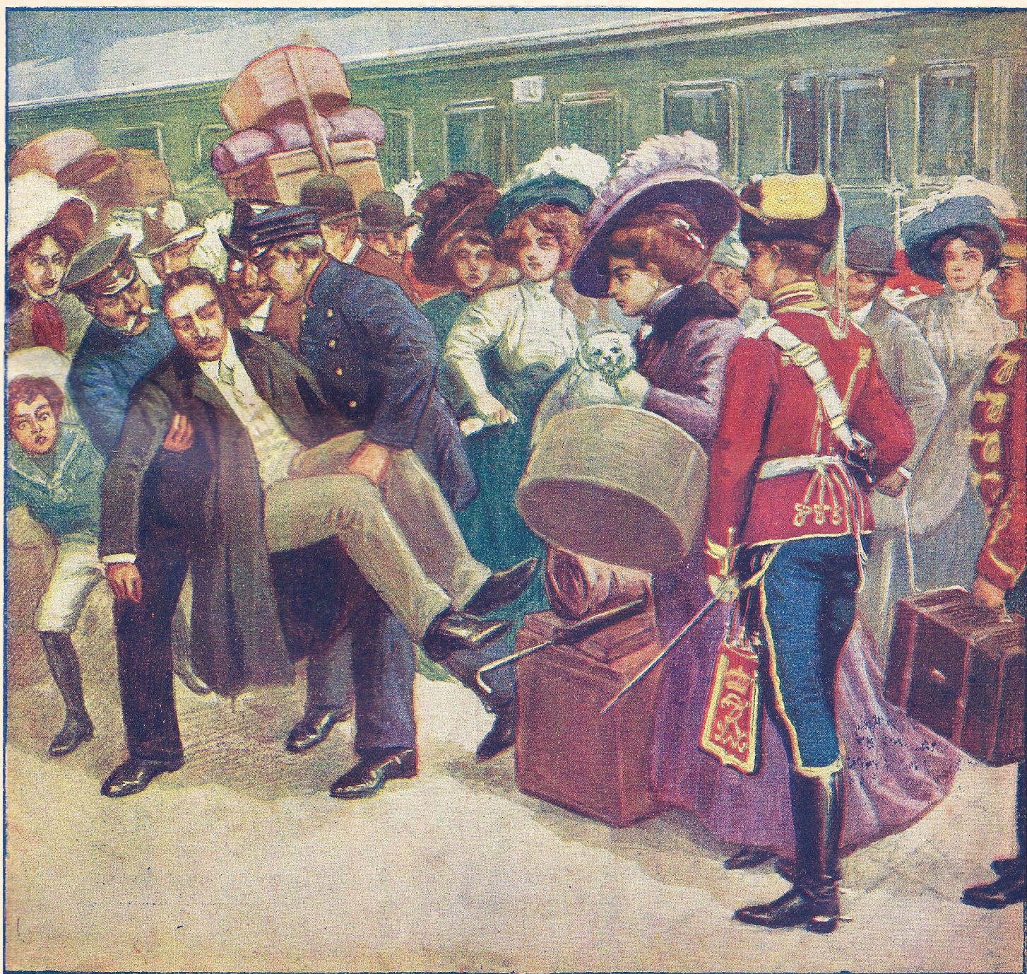
Twee treinbeambten droegen het verstijfde lichaam over het perron.